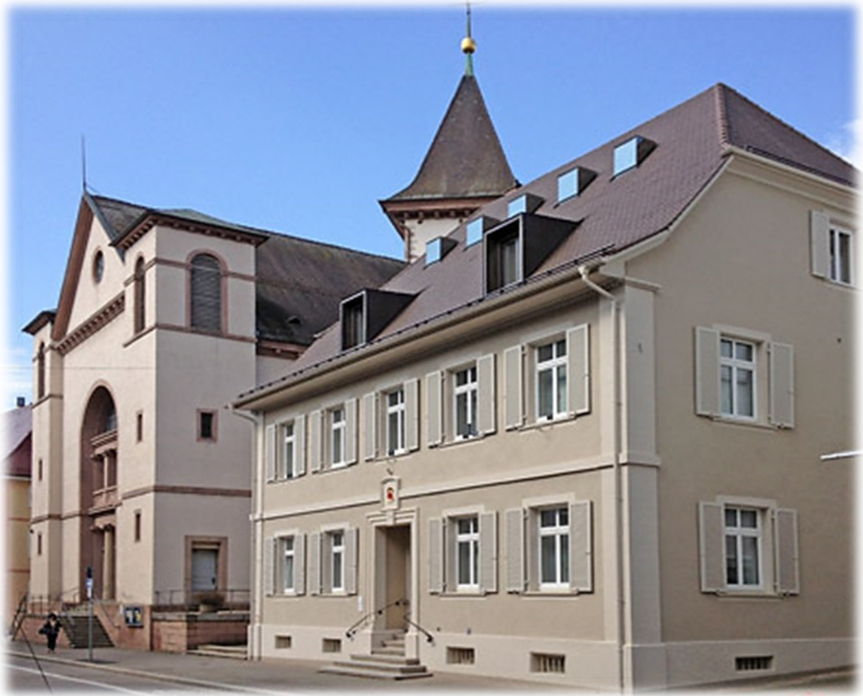
Haus der Kirche, Basler Str. 147