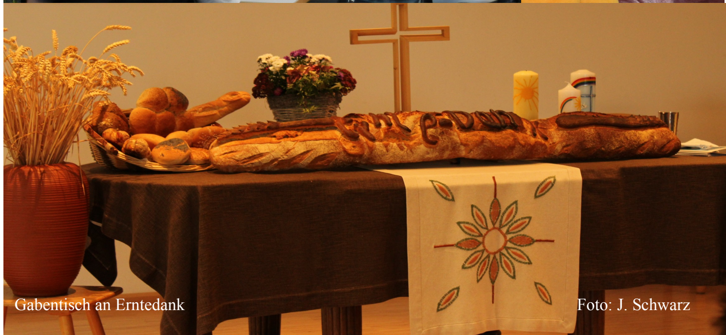
Gabentisch an Erntedank