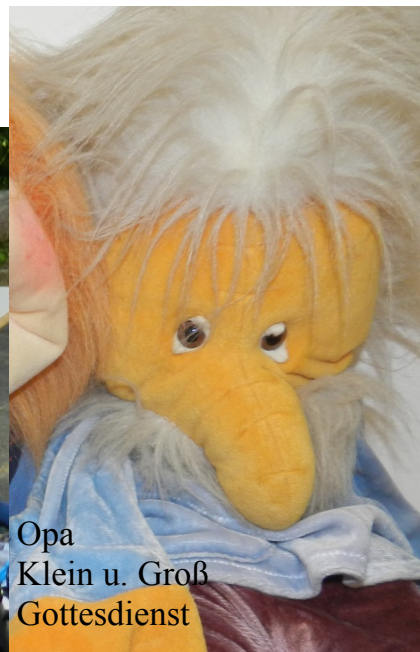
Opa Klein u. Groß Gottesdienst