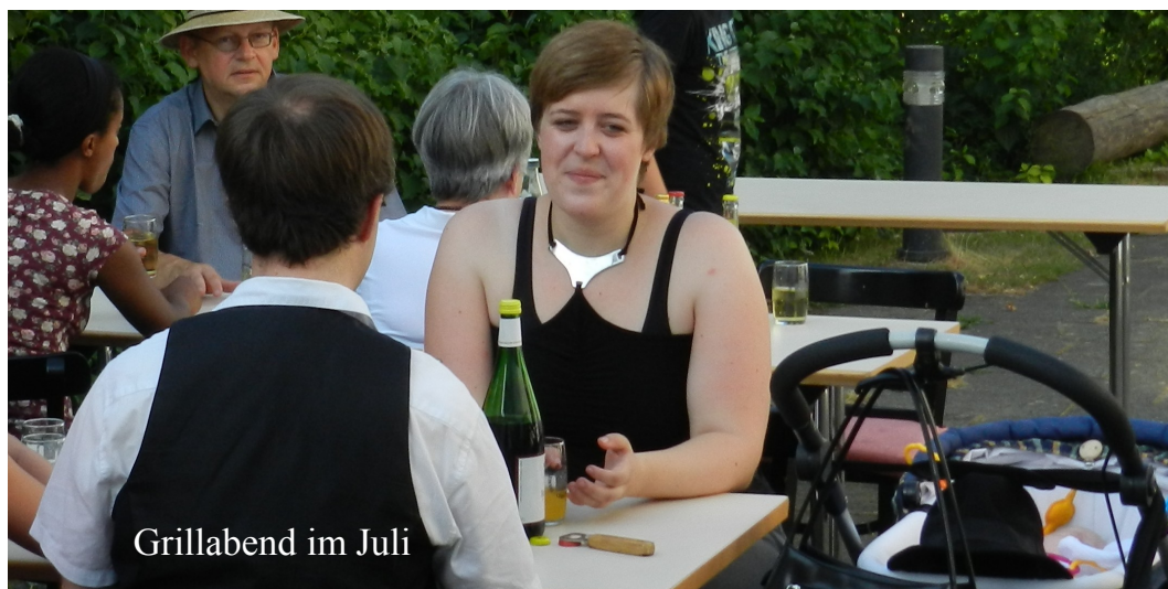
Grillabend im Juli